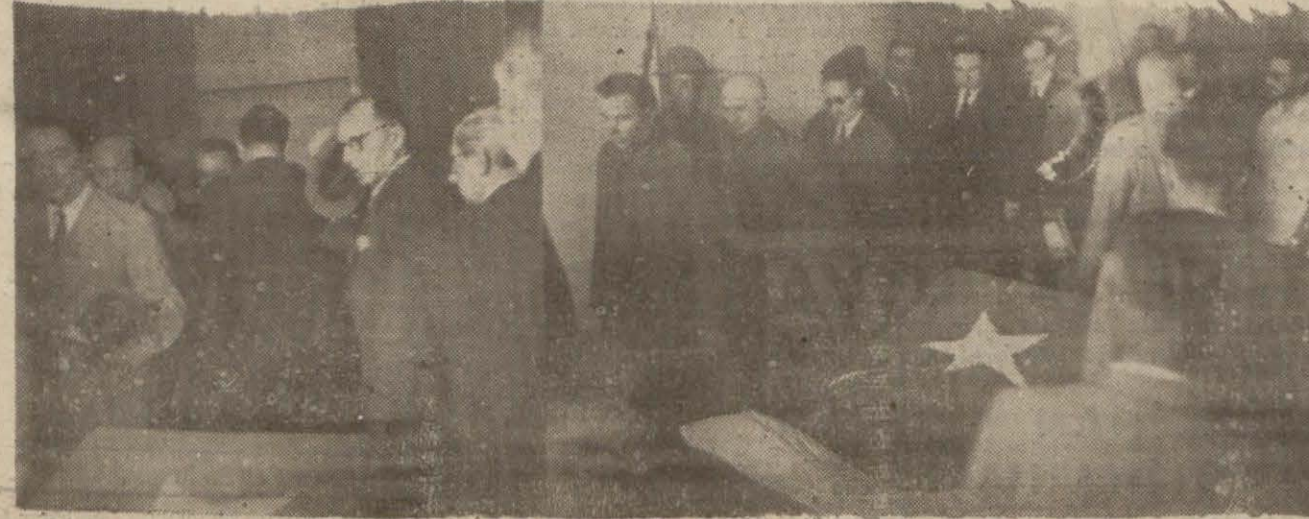
Vekiller, meb'uslar, şehrin büyükleri, dostları ona son saygı ve sevgi vazifelerini ifa ederlerken