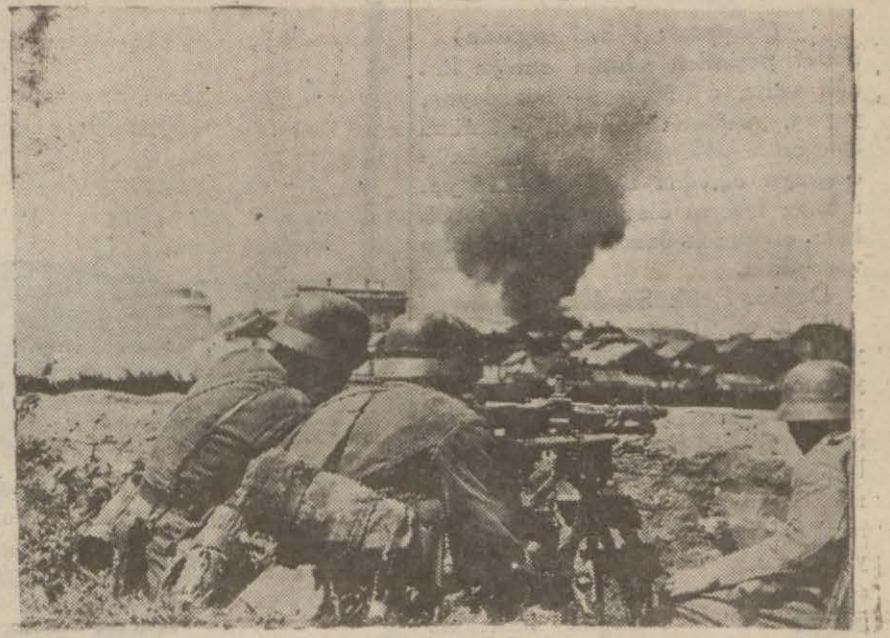
Alman askerleri bir Sovyet şehrinin karargâhında

Yeni kabinenin programında merhum Dr. Refik Saydam kabinesinin çalışma programındaki ana çizgileri aynen muhafaza etmesi tabii görülmektedir.